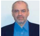
Ο Βουλευτής Αρκαδίας, του ΣΥΡΙΖΑ, Γεωργίου Παπαδημιτρίου ,

κατά την παρουσίαση του Αναπτυξιακού Προγράμματος Πελοποννήσου, στην Ειδική Επιτροπή Περιφερειών της Βουλής, ανάμεσα στις θέσεις και τις προτάσεις του ήταν και οι παρακάτω: